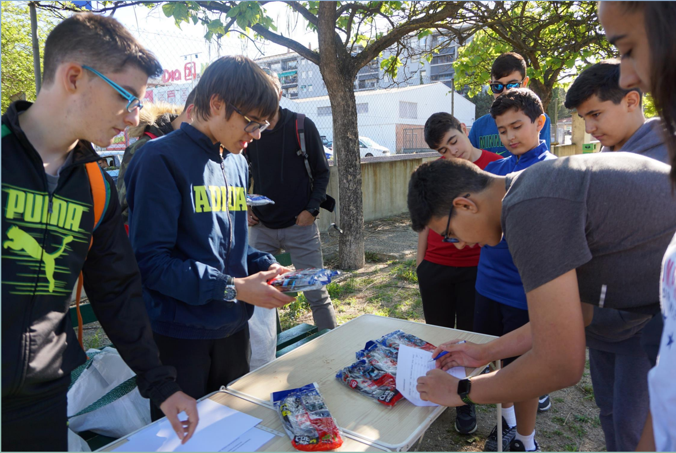
Omplint dades dels voluntaris