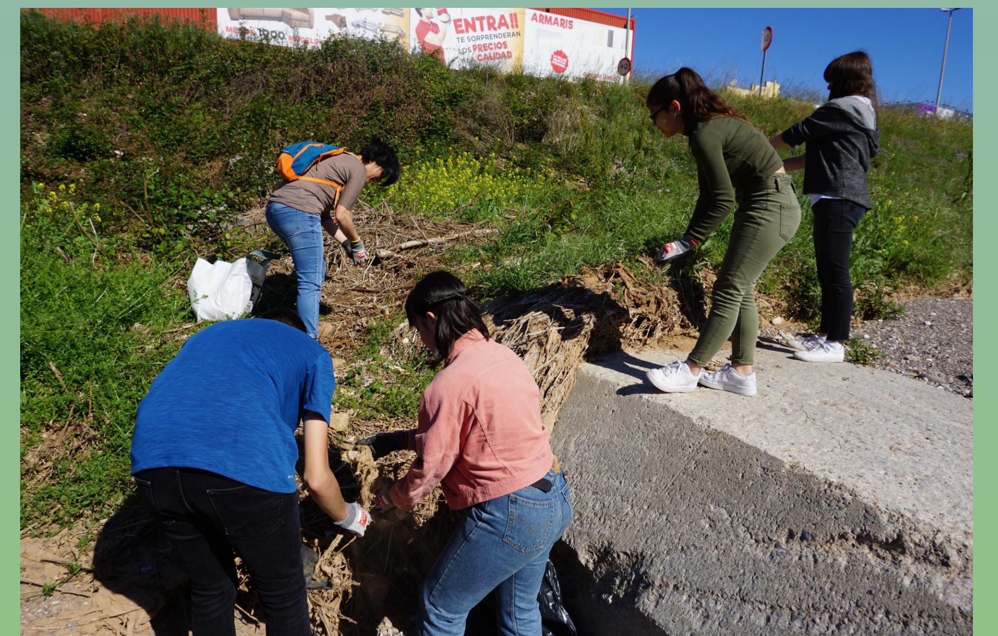
Diferents moments de la recollida comunitària de residus