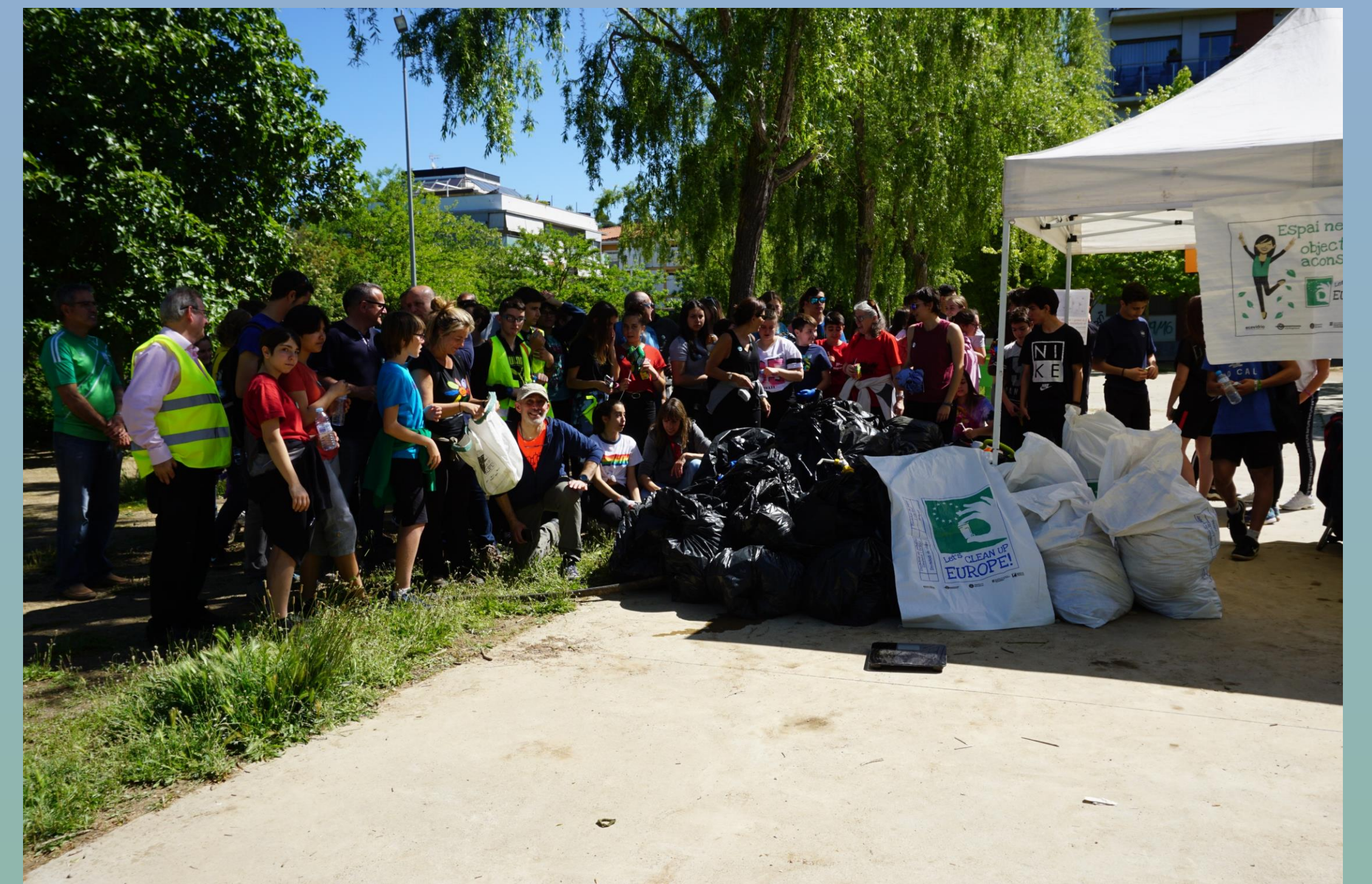
Participants i residus recollits